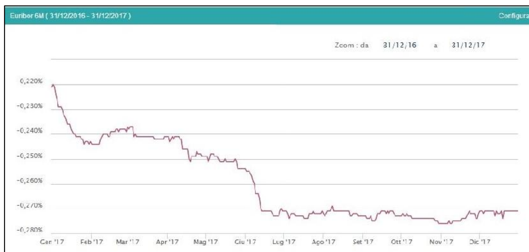
GRAFICO 1: ANDAMENTO DELL'INDICE EURIBOR 6 MESI

In riferimento invece alla rischiosità degli investimenti in titoli obbligazionari, in particolare in riferimento ai titoli di stato italiani, le quotazioni dei Credit Default Swap collegati, nel corso del 2017, hanno subito una forte discesa, ciò comporta una minore rischiosità collegata al Sinking Fund . Inoltre il Rating della Repubblica Italiana ha recentemente subito una variazione positiva ( upgrading ) da Standard&Poor ad un livello pari a BBB dal precedente BBB-, promozione avvenuta il 27 ottobre 2017.